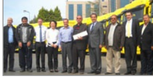
Şahin Nakliyat'ın filosunda sadece DAF'a yer var